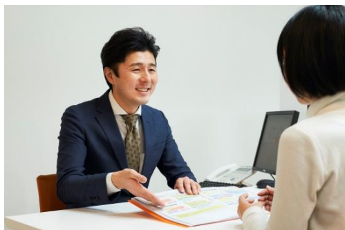
保険について疑問な事・不安な事は何でもお聞かせください。

(全国189店舗、甲信越地区で11店舗、山梨県で2店舗 2019年1月28日時点)