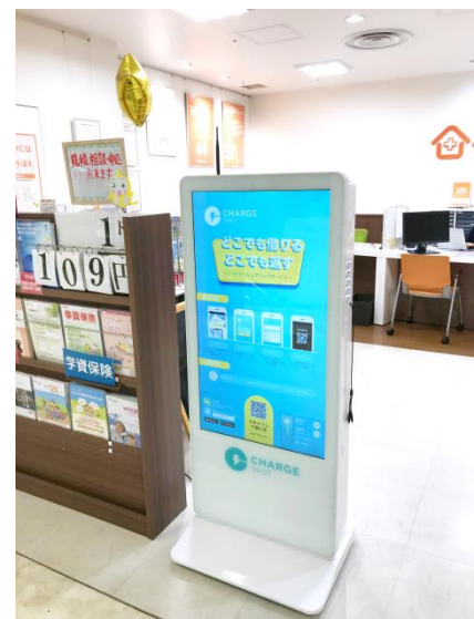
店舗での「ChargeSPOT」設置イメージ

今回初回導入店舗として、東京都品川区、神奈川県川崎市の『保険クリニック』2店舗に「ChargeSPOT」を設置いたしました。今回導入したタイプは20個分のスロットを搭載しています。ご利用を希望される方は、「ChargeSPOT」アプリをダウンロード後に、「ChargeSPOT」本体の画面に表示されるQRコードをアプリで読み取り、バッテリーを借りる仕組みです。