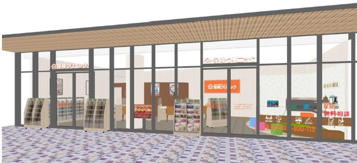
店舗外観イメージ