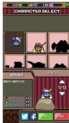
ゲームをたくさん遊ぶと、 個性豊かなキャラがゲットできる!

— OBOKAIDEM への取材・各タイトル・各種素材提供に関する報道お問い合わせ先 —