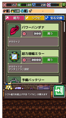
集めたジェムを使って装備購入! パワーアップしてクリアを目指す