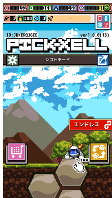
メインタイトル画面。 可愛いキャラをゲットし掘り進め!