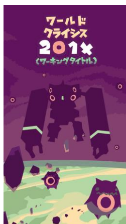
『ワールドクライシス 201X』 (ワーキングタイトル)

海賊の財宝をクレーンで引き上げる 滑らか操作が癖になる 新感覚クレーンアクションゲーム (共同開発:KEYROUTE)