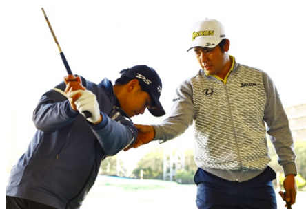
■2024年度ジュニアレッスンの様子

「Baycurrent Classic Presented by LEXUS」本戦においても、上記アマチュア予選会や、出場プロとのラウンド機会の提供を始め、次世代へ向けた支援として日本高等学校・中学校ゴルフ連盟と連携した取り組みを行ってまいります。