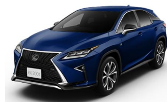
RX200t “F SPORT”