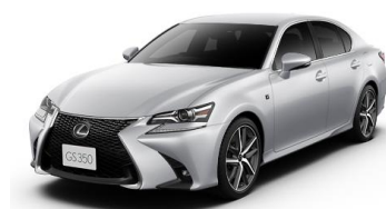
GS350 “F SPORT”