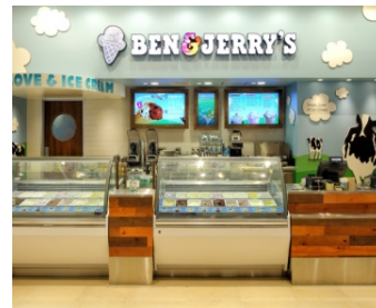
ベン&ジェリーズららぽーと豊洲店： 東京都江東区豊洲2丁目4番9号 アーバンドックららぽーと豊洲1階