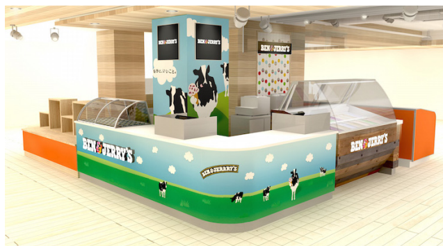
上：エキマルシェ大阪 期間限定ショップ(イメージ図)

合成着色料は不使用。ていねいに育てた健康な牛のミルク、平飼いニワトリの卵など、安心して上質な素材で作られたアイスクリーム。おいしさだけでなく、バニラやカカオなどフェアトレードの原材料、持続可能な酪農法などにもこだわり、食べる人も作る人も、牛やニワトリ、地球まで、みんながハッピーになれる「いいこと」が詰まっています。うっとり、とろけちゃうようなおいしさ、ショップでもおうちでも、まずはいっぺん食べてみて！