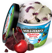
左：今年3月より関西でもミニカップアイスクリームの販売をスタートしました！

【オープン日限定】 オープン日の5月31日は、スクープのアイスクリームを購入いただいた方に「ストロベリー」1スクープを無料でプレゼント！また、ミニカップバラエティボックスをご購入いただいた方には、ベン&ジェリーズの限定スプーンをお贈りします。*どちらも無くなり次第終了となります。ご了承ください。