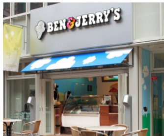
ベン&ジェリーズコビス吉祥寺店： 東京都武蔵野市吉祥寺本町1丁目11 番5号 コビス吉祥寺1階