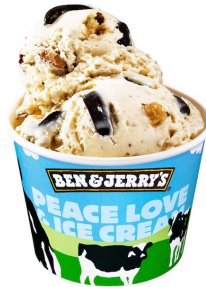
チャンキーモンキー