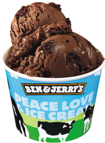
チョコレート ファッジ ブラウニー