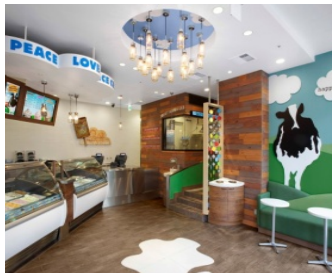
ベン&ジェリーズ表参道ヒルズ店： 東京都渋谷区神宮前4丁目12番10号 表参道ヒルズ同潤館1階