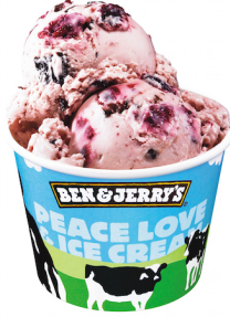
チェリーガルシア