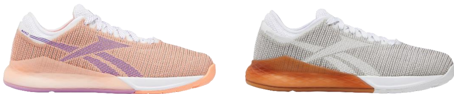
名称： クロスフィット ナノ 9.0 W