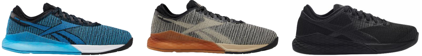
名称： クロスフィット ナノ 9.0 M