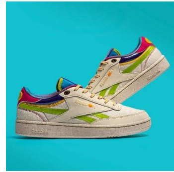
名称： CLUB C REVENGE (クラブ シー リベンジ)