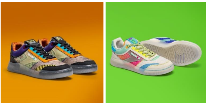
名称： CLUB C LEGACY (クラブ シー レガシー)