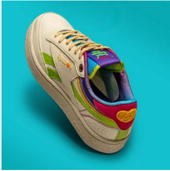
名称： CLUB C INF (クラブ シー INF)