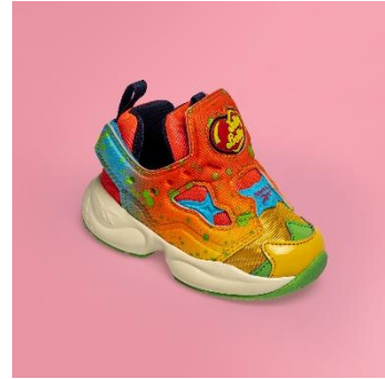
名称： FURY INF (フューリー INF)