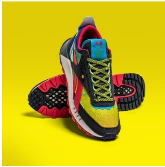
名称： CL LEGACY (クラシック レザー レガシー)