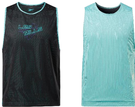
名称： LesMills Reversible Pinny（レズミルズ リバーシブル ピニー）

リバーシブルデザインで 2 つのルックスを楽しむことができるウェアが登場。ゆとりのあるリラックスフィットのため、ワークアウト中も動きを邪魔せず快適に着用いただけます。メッシュ素材が優れた通気性をもたらす、暑い季節のワークアウトでも不快感なく、パフォーマンスをサポートします。