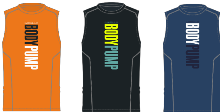
名称： LesMills BodyPump Muscle Tank（レズミルズ ボディバンプ マッスルタンク）

最もタフなワークアウトに適したタンクトップ型。通気性の良いアクティブチル素材のため、汗をかき始めても身体をクールに維持します。さらに、背中中のメッシュ素材は高強度でもワークアウトで通気性を発揮。胸部に施されたレズミルズのグラフィックがアクセントになっています。