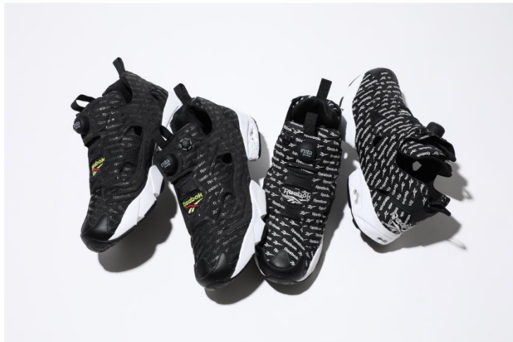
名称： "INSTAPUMP FURY OG (インスタポンプフューリー OG)