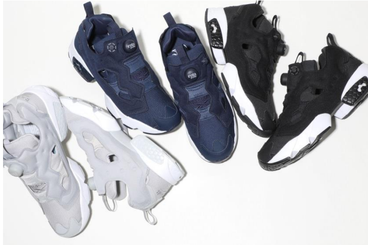
名称： INSTAPUMP FURY OG "BALLISTICK PACK" (インスタポンプフューリー OG "バリスティックパック")