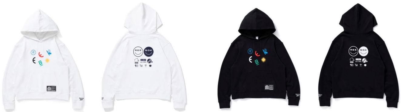
名称： LT HD BEP (LT フーディー ビーイーピー)