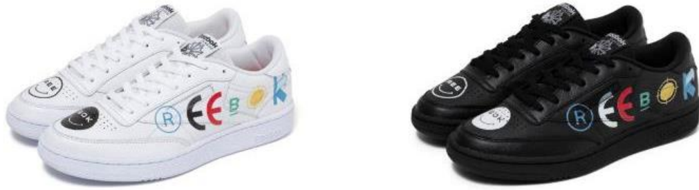
名称： CLUB C 85 BEP (クラブシー 85 ビーイーピー)