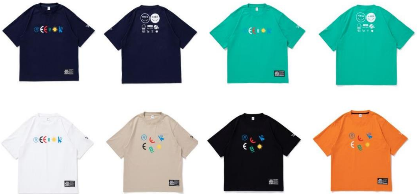
名称： SS Tee 1 BEP (ショートスリーブ T シャツ 1 ビーイーピー)