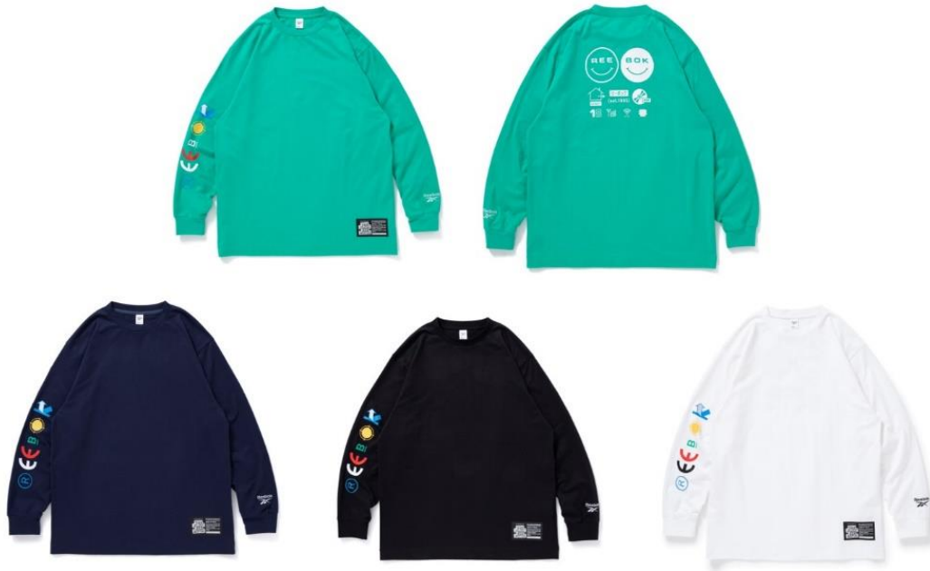
名称： LS Tee 1 BEP (ロングスリーブ Tシャツ 1 ビーイーピー)