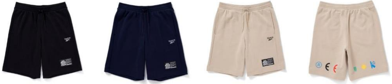
名称 : Shorts BEP (ショーツ ビーイーピー)