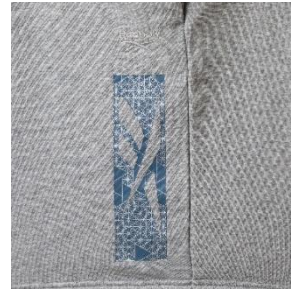
名称： CL TOKYO ST (シーエル トーキョー ショーツ)