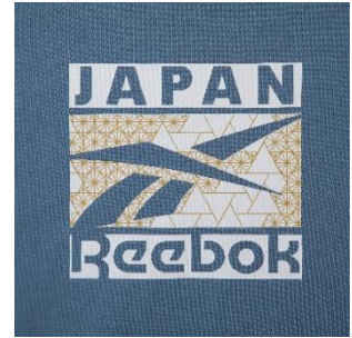
名称： CL TOKYO TEE2 (シーエル トーキョー ティー2)