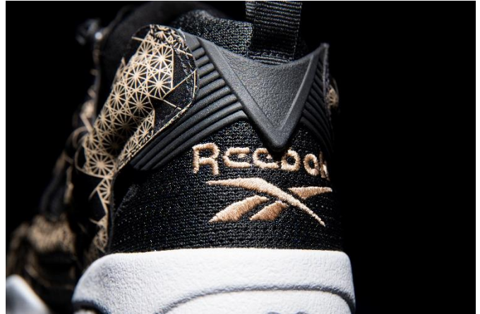
名称： INSTAPUMP FURY（インスタポンプフューリー）