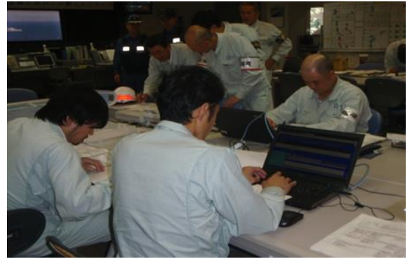
情報収集整理・入力(エンプレス)訓練