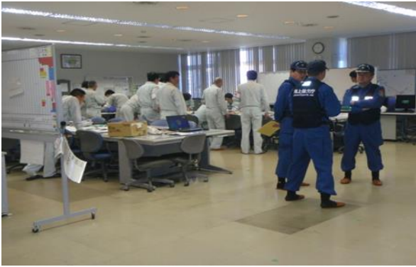
中央監視制御室(CCR)での自衛防災組織対策本部(現地災害対策本部)設置訓練