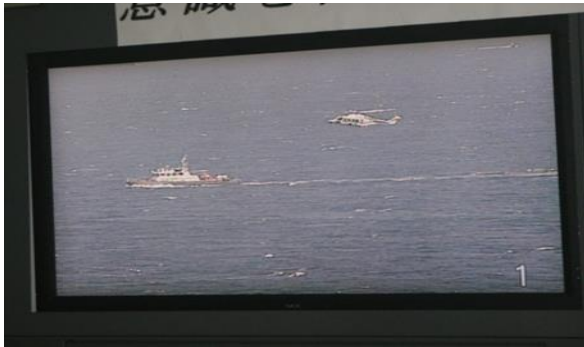
監視カメラにて海保ヘリ負傷者吊り上げ收容確認