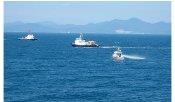
流出油防除訓練(オイルフェンス展張・放水攪拌・ガス検知)