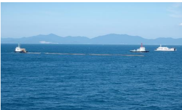
流出油防除訓練(オイルフェンス展張・航走攪拌)