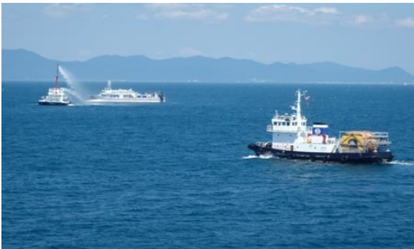
消火訓練(交通船機関室から出火)