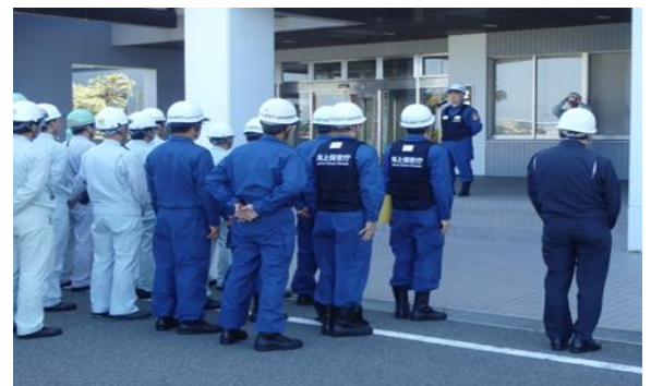
訓練終了後の若松海上保安部からの講評