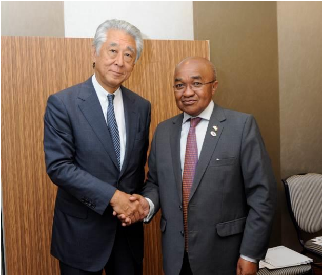
マダガスカル ララハリサイナ 鉱物・石油担当大統領府付大臣