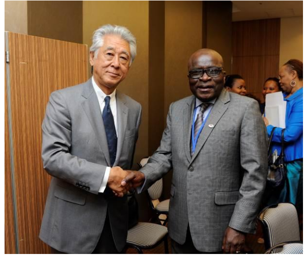
南アフリカ ラマトロディ鉱物資源大臣