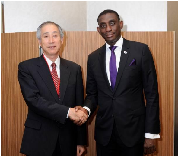
ニジェール チアナ 鉱山・産業開発担当国務大臣