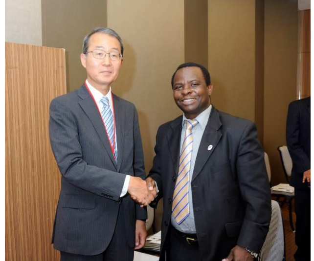
タンザニア ナヨパ エネルギー・鉱物省副局長