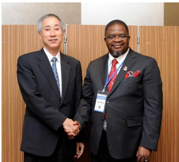
マラウイ ムサカ天然資源・エネルギー・鉱業大臣