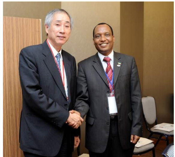
エチオピア セミエ鉱業副大臣