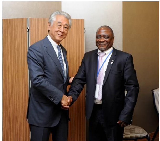
ナミビア シボロ鉱山・エネルギー省鉱業コミッショナー