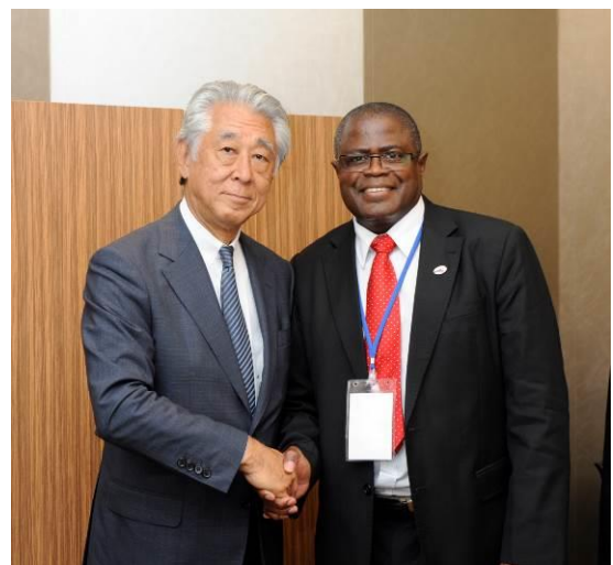
ザンビア ヤルマ 鉱山・エネルギー・水開発大臣