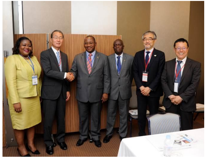
モザンビーク アレクサンドレ 鉱物資源省 鉱山局長