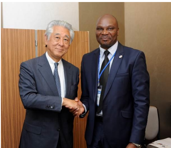
ジンバブエ チダクワ 鉱山・鉱業開発大臣