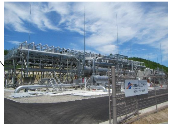
菅原バイナリー発電所全景