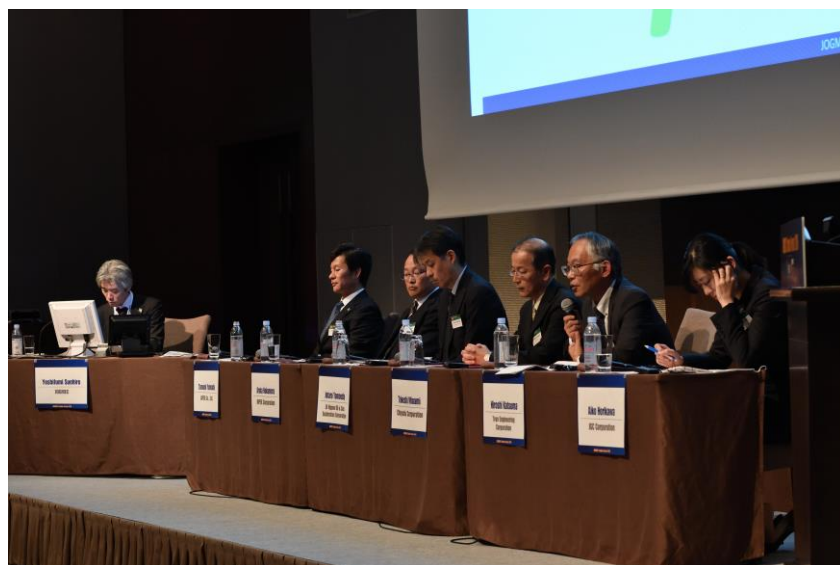
Day 2 テクニカルディスカッション 「コスト削減」、「効率向上」、「アライアンス」～今求められる技術と行動とは？～