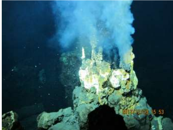
写真 1: 東青ヶ島鉱床で確認された 高温(約 260 度)の熱水を噴出するマウンド