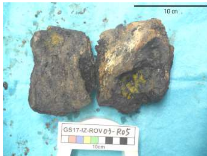
写真 2: 東青ヶ島鉱床から採取した鉱石 (銅 1.3%、鉛 15.9%、亜鉛 24.2%、金 37.6 グラム/トン、銀 2,160 グラム/トン)