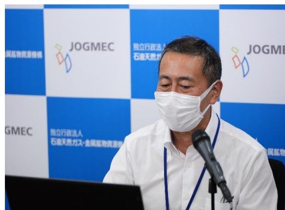
令和4年度 石炭開発部 石炭需給動向ブリーフィング講演の様子

JOGMEC は、我が国への石炭の安定供給を目的として、世界各国で、地質構造調査、人材育成・技術移転事業、情報収集活動、技術支援事業を行っています。