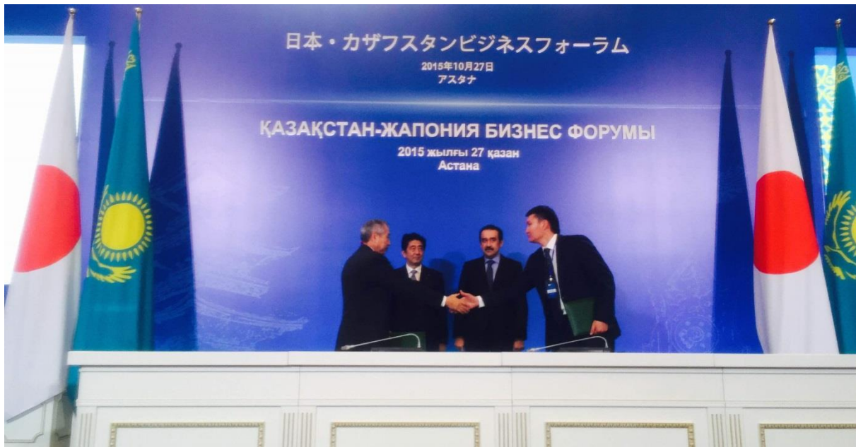
(左から)黒木副理事長、安倍総理、マシモフ首相、ヌルジャンフ社長