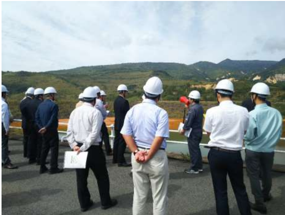
現地見学会(貯泥ダムより八幡平地すべり方面を望む)