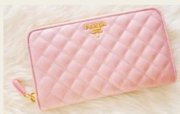
■PRADA (プラダ) ¥69,800 22%OFF