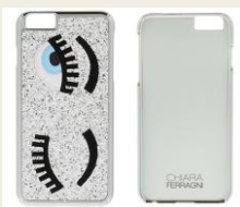
■Chiara Ferragni (キアラフェラーニ) ¥5,800 10%OFF