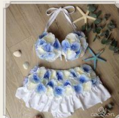
■Chuan Pisamai (チュアンピサマイ) ¥13,800 6%OFF