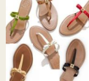
■Tory Burch (トリーバーチ) ¥19,900 29%OFF