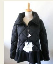
■MONCLER (モンクレール) ¥149,200 21%OFF

【BUYMA(バイマ)】 http://www.buyma.com/?af=601