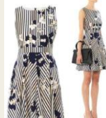
■DIANE von FURSTENBERG (ダイアンフォンファステンバーグ) ¥33,500 62%OFF