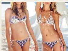
■Victoria's secret (ヴィクトリアシークレット) ¥5,800 10%OFF