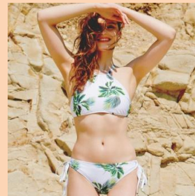
ハイネック (ホワイト)

そこでBUYMAでは、“3モデル・スピード完売キャンペーン”として、お得な1,000円オフクーポンをプレゼント。在庫残りわずかの水着がお得に手に入る最後のチャンス！夏休みの旅行やフェスなどでも目立つこと間違いなしです♪即日発送なのですぐに欲しい方にもオススメです。