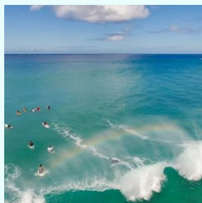
おすすめ サーフスポット案内