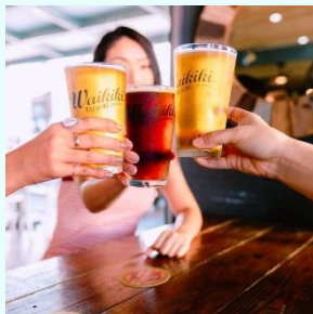
クラフトビール巡りツアー