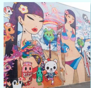
カカアコウォールアートで 一眼レフ撮影