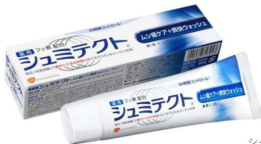
シュミテクト ® ムシ歯ケア+爽快ウォッシュ

風邪薬の「コンタック ® 」や、歯磨き剤「アクアフレッシュ ® 」など、お馴染みのブランドを有する英国系製薬企業グラクソ・スミスクライン株式会社(本社:東京都渋谷区、以下 GSK)は、知覚過敏ケア歯磨きブランド「シュミテクト ® 」シリーズから、新処方を採用した「シュミテクト ® ムシ歯ケア+爽快ウォッシュ」と、パッケージをリニューアルした「シュミテクト ® デイリーケア+」を3月1日から発売します。