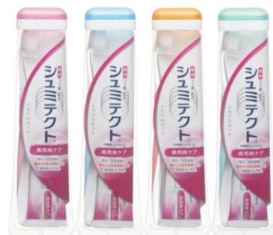
シュミテクト ® トラベルセット

新CMキャラクターには、明るく、活動的、オーラルケアに対しても積極的に取り組んでいるフリーアナウンサー・タレントとして活躍している西尾由佳理さんを起用しました。去年からCM出演している女優の黒谷友香さんと共に、「シュミテクト ® 」が知覚過敏症状の予防だけでなく、気になるオーラルケアをサポートする毎日のハミガキとしてふさわしい製品であることを伝えていきます。