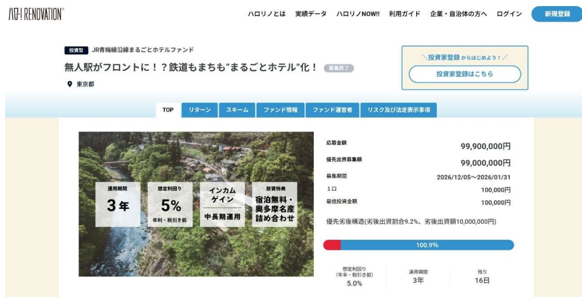
ハロー！RENOVATION ファンドページ

本ファンドは、エンジョイワークスが運営する地域活性化に特化した不動産クラウドファンディング「ハロー！RENOVATION（ハロリノ）」（※1）を通じて組成され、2025 年 12 月 5 日の募集開始から約 3 週間で満額に到達しました。