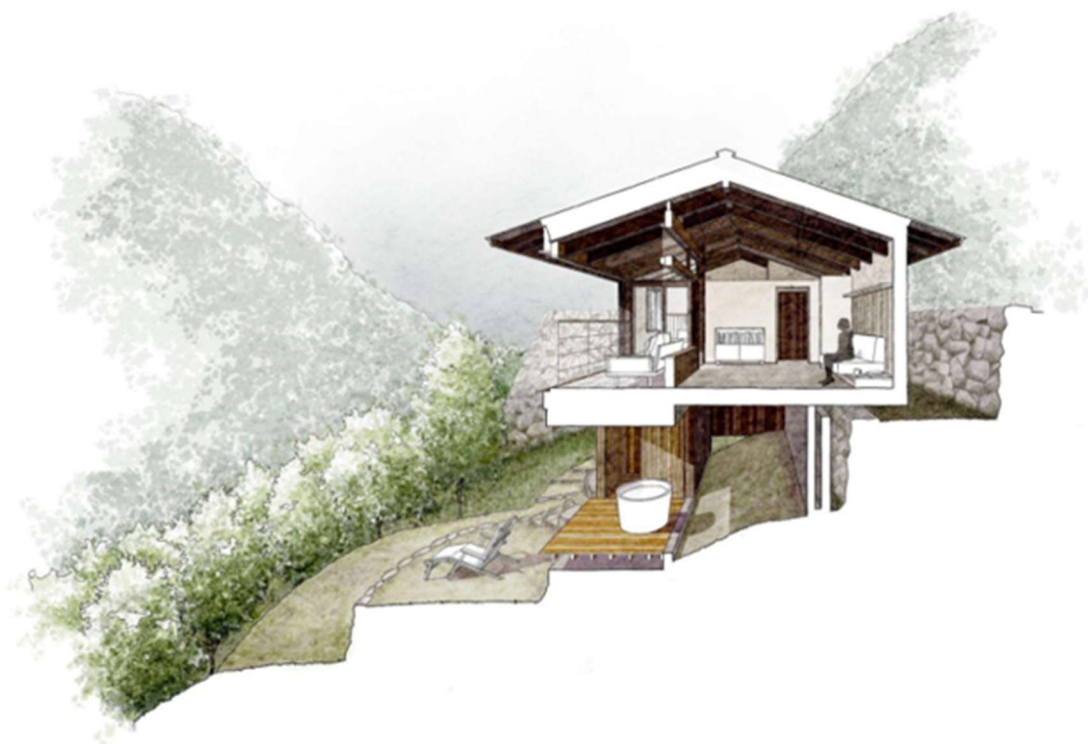
開業施設イメージイラスト

今回のファンド達成という結果は、両社の連携体制が有効に機能した成果と言えます。また、このような取り組みが、持続可能な地域活性化事業への参加型支援モデルとして成立しつつあることを示す一例となりました。