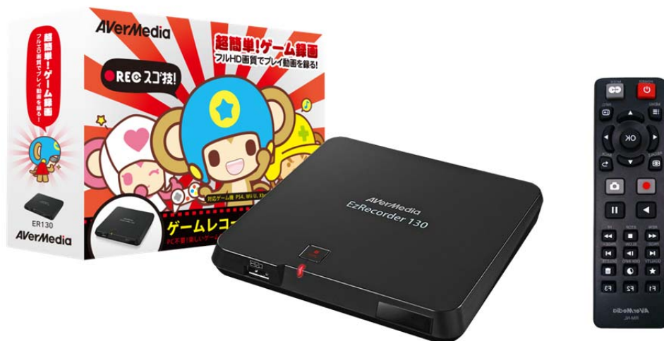
【ER130 化粧箱・製品本体・付属リモコン】

新世代ゲーム機の多くは、動画共有機能を標準搭載しているものの、画質や録画時間の制限があります。ER130は、ゲーム機に標準で搭載されているキャプチャー機能だけでは満足することができなくなってきた、本格的なゲーム実況にこれからチャレンジしたい人にとって最適な製品です。