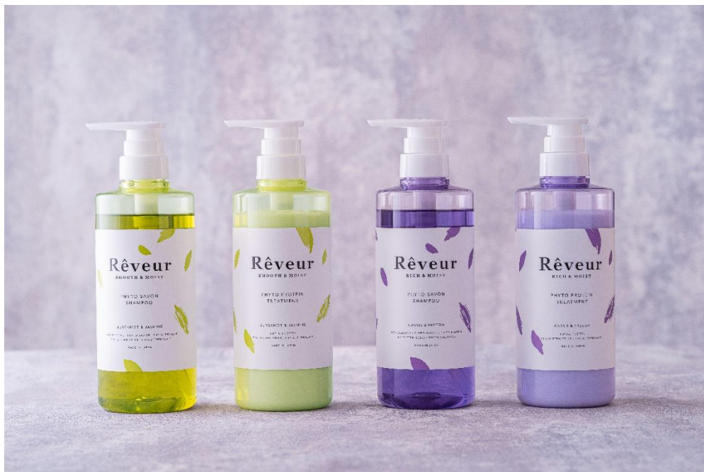
レヴールシリーズ

株式会社ジャパン ゲートウェイ(所在地：東京都港区 代表：伊藤英信)が展開する、ノンシリコンシャンプーの先駆けとなったヘアケアブランド『レヴール』は、2020年9月15日（火）新たに、フィトプロテイン（100%植物性たんぱく質）を洗いながら補給し、うるおいを与えるフィトプロテインヘアケアシリーズを発売します。同日より全国ドラッグストア、ショッピングサイトにて順次販売を開始いたします。