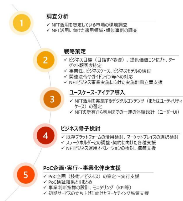
図：イグニション・ポイントのNFT活用に関するコンサルティングサービスの特徴

イグニション・ポイントは今後も、ビジョンである『ゆたかさを生み出すあらゆる革新のプラットフォームになる』を体現するため、NFTを含む先端技術を活用した企業の経営変革・事業構想を包括的に伴走支援し、日本の社会・産業構造の発展に貢献してまいります。