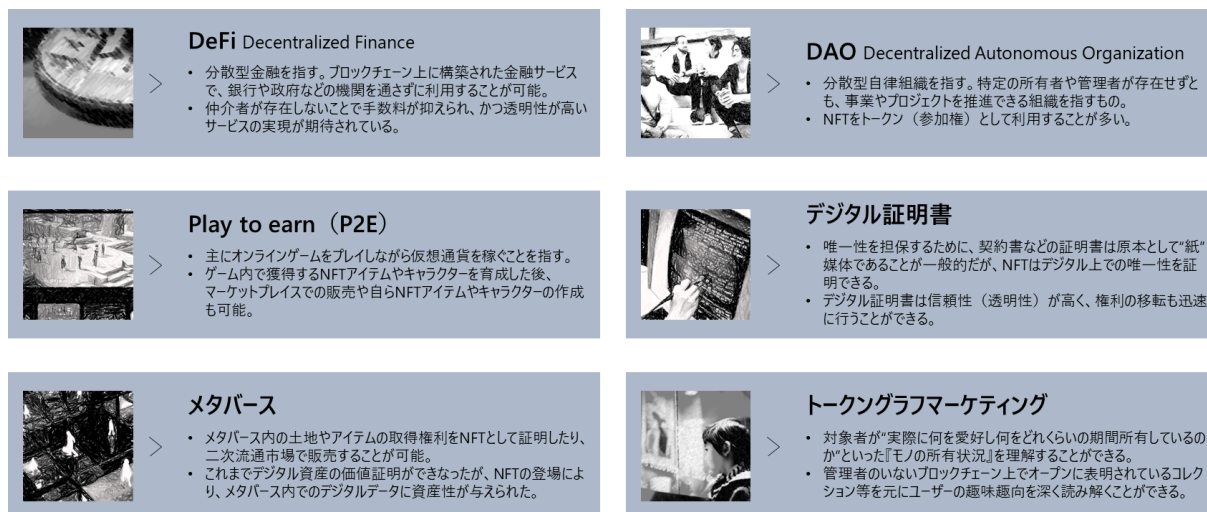
図：今後、想定されるNFT活用例

このような背景から、NFTビジネスの運営実績（MachUps）を有するイグニッション・ポイントは、Web3社会に向けた新規ビジネス創出のNFT活用をサポートするコンサルティングサービスの提供を開始することとなりました。