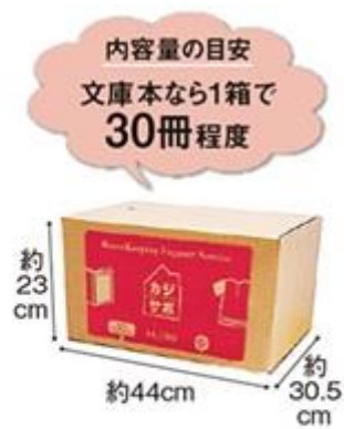
お預かりボックス〈スモール〉