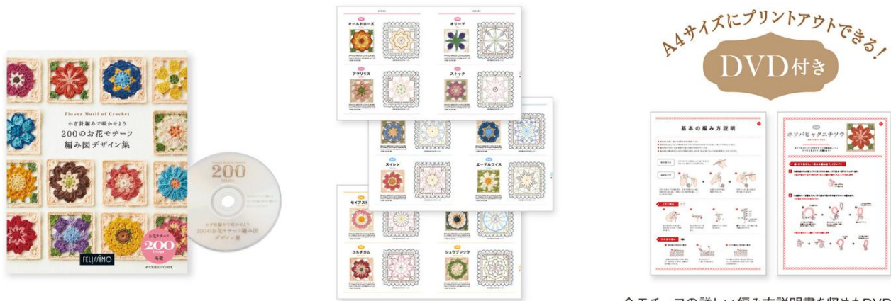
200種類のモチーフのできあがり写真と編み図を紹介。全モチーフの詳しい編み方説明書を収めたDVD付き。かぎ針編みの基本的な編み方も収録。