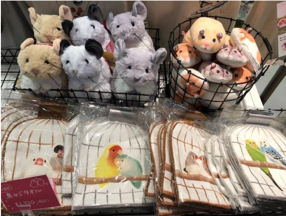
SNSで話題になった「抱っこ牡蠣」「カワウソポーチ」も。