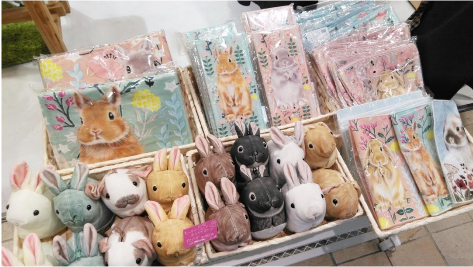
新商品「チンチラポーチ」「鳥かごタオル」も販売しています。