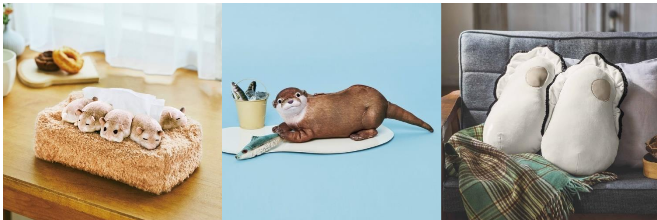
(左より) ハムスターティッシュケース、もっちりかわウソポーチ、牡蠣のクッション (数に限りがございます。売り切れの節はご容赦ください。)