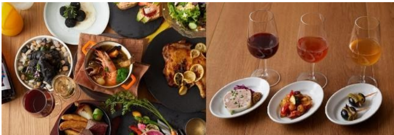
左：ランチ、ディナー共にディック・ブルーナが生まれ育ったオランダの郷土料理を取り入れたメニューをラインナップ 右：ワインタップからのサーブが珍しい蔵出しワインはソムリエのセレクトで随時銘柄が変わります