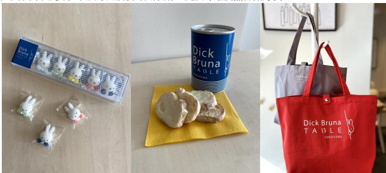
コーヒーが染みると「ミッフィーが茶色くなる！」SNSで話題のミッフィーシュガーや缶のお菓子〈ホワイトチョコラスク〉はYOKOHAMA限定カラーの青いパッケージをご用意。オリジナルトートにも限定で赤が登場します。YOKOHAMA限定のトートバッグをご購入された方にオリジナルパッチを1個プレゼント。(3月10日～21日の12日間 毎日先着50名。)グッズを5,000円以上お買い上げの方にオリジナルチャームをプレゼントするキャンペーンを実施します。(3月末まで)