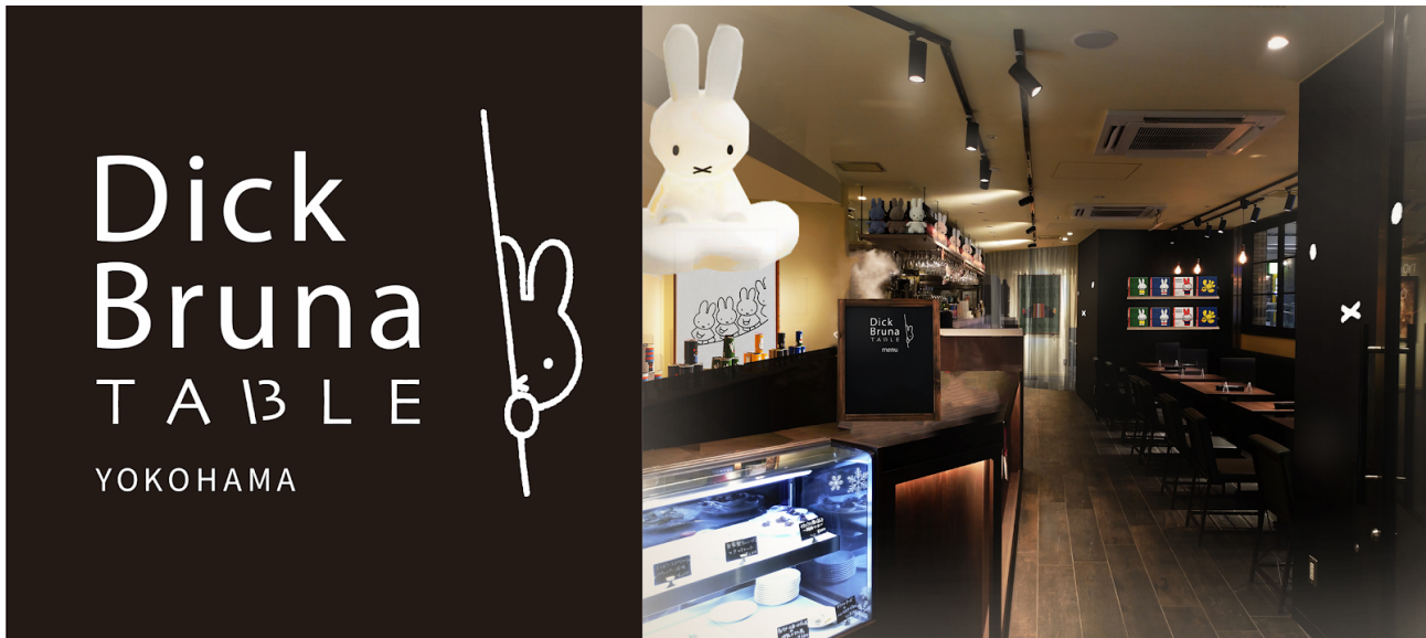
*店舗画像はイメージです。

（※3）混雑を避けるため、テイクアウトのサービス開始は別日となります。日時の詳細は追ってご案内いたします。キャンペーンの内容についても変更を行う場合があります。