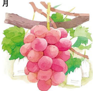
京都府産 白岩農園 ぶどう「紅伊豆」 約450g×2房