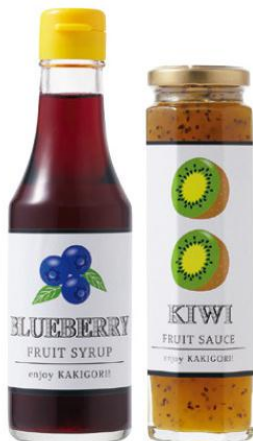
● 1回のお届けセット例です。