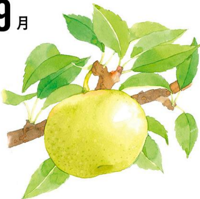
京都府産 白岩農園 二十世紀梨 約350g×6玉