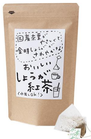
テトラタイプティーバッグ×20個