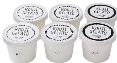
● 1回のお届けセット例です。