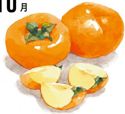
奈良県産 堀内農園 樹上完熟「刀根柿」 約2kg 7~10玉