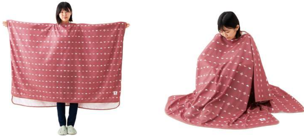
ブランケットやショールにも変身★ すっぽり隠れるお着替えポンチョ

3.防犯 & 片付け問題…お守りブザー & 必需品をさっとまとめるお助け収納 不特定多数の人たちが集まる場所では犯罪が怖いです。そこで、可愛いデザインで持ち歩きやすい防犯ブザーが付属しています。ブザーは古くから「不苦労」の当て字から苦労を遠ざけるとされる「ふくろう」をモチーフにしています。また、手持ちの衣類を細かく圧縮できる収納袋と、薬とサプリメントをまとめられるケースも付属しています。