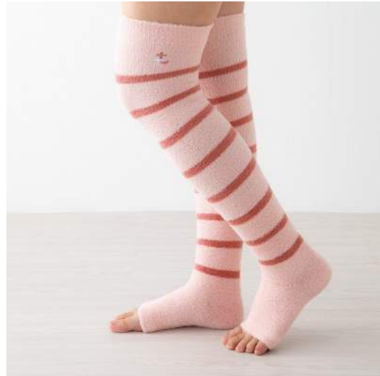
寒い寒いの飛んでいけ?! ふわもこほっこりあったかセット