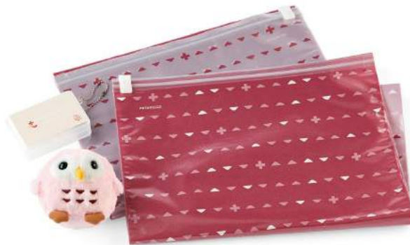
もふっと危険を伝えるお守りブザー & 必需品をさっとまとめるお助け収納

3.防犯 & 片付け問題…お守りブザー & 必需品をさっとまとめるお助け収納 不特定多数の人たちが集まる場所では犯罪が怖いです。そこで、可愛いデザインで持ち歩きやすい防犯ブザーが付属しています。ブザーは古くから「不苦労」の当て字から苦労を遠ざけるとされる「ふくろう」をモチーフにしています。また、手持ちの衣類を細かく圧縮できる収納袋と、薬とサプリメントをまとめられるケースも付属しています。