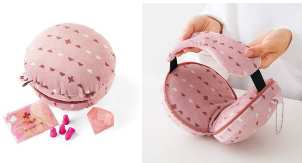
着ければそこはあなたの世界 目と耳を休めてリフレッシュセット

避難所は人が多すぎてなかなか眠れないこともあります。そこで耳栓やアイマスクをセットしました。ケースのファスナーを開けるとアイマスクに変わります。またいつでも握れてリフレッシュできる指圧ボールもつけています。