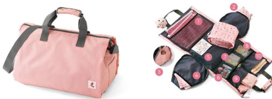
スピーディー & 忘れもの知らず♪ がばっと開くガジェット魔法バッグ

10コのポケットで荷物が整い、ジッパー開閉でがばっと全開できるガジェットバッグです。中身が一目瞭然なので、時間がないときでも確認しやすいです。