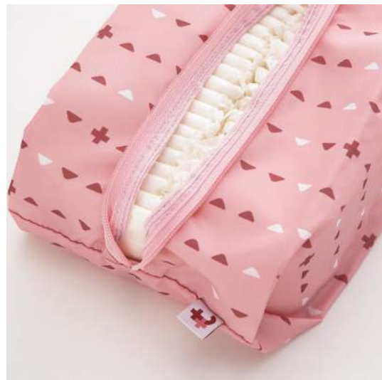
月のサイクルにもあわせて対応 物資不足 & 気になりポイントを解決セット

【NEW】 みんなのBOSAI もしもしも® どんなときでも私らしく過ごすための7つの魔法の会(おまけ付き)