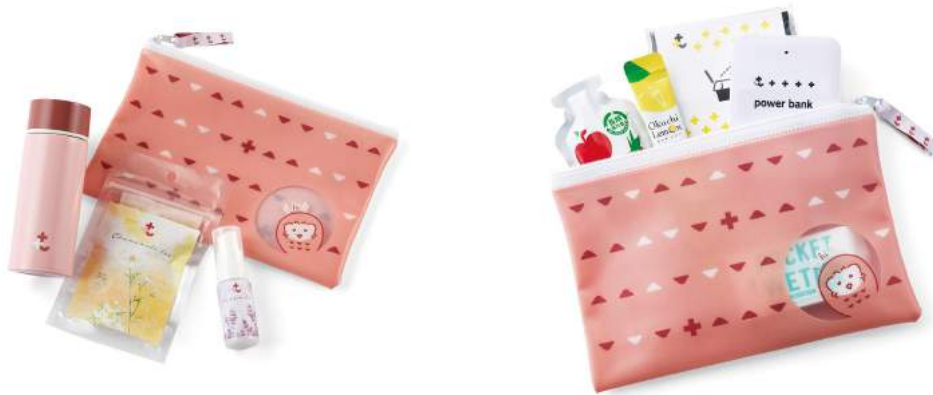
香りと味でほっとゆるまる 癒やしの魔法セット

防災時は周囲のことを気にかけてピリピリしてしまいがちです。自分の心を癒やすグッズを入れるポーチを用意しました。匂いを和らげるリネンスプレーといざというときに飲めるカモミールティーもステンレスボトルもともに添えています。