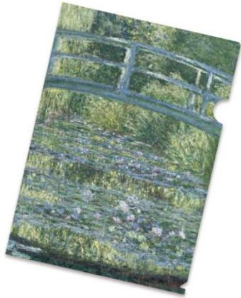
「睡蓮」のクリアフォルダー