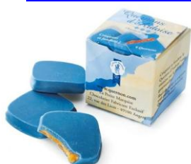
●ナッツ類を刻んで餡がけし、チョココーティング。