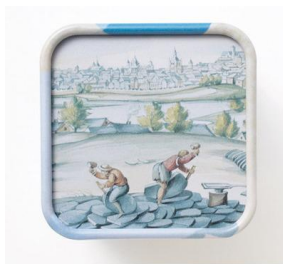
缶の底にもかわいいイラストが。