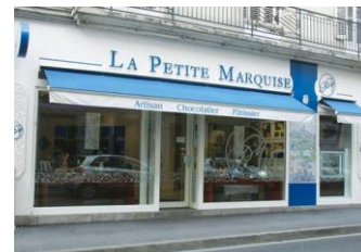
●フランス西部の「ラ・プティ・マルキーズ」