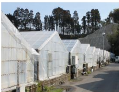
鹿児島県の中でも養鰻が盛んな大隅地区、中でも大崎町は国内最大規模を誇ります。