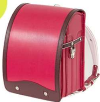
ローズピンク × ワイン ¥74,000 + 税