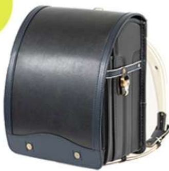
ブラック × ネイビー ¥74,000 + 税

「鞆工房山本さんをつくった フェリシモオリジナル日本のランドセル」特設サイトはこちら>> https://www.feli.jp/s/pr18051003/1/