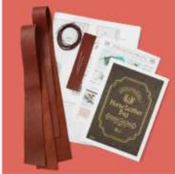
1回のお届けセット例