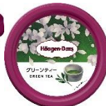
▲古屋絵菜デザイン