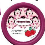
▲maegamimami (マエガミマミ) デザイン