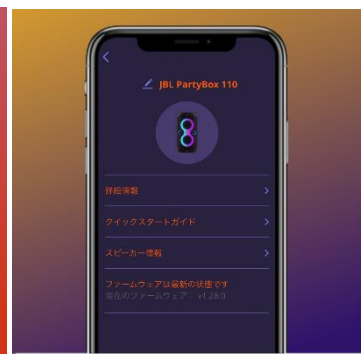
▲③ソフトウェア アップデート画面