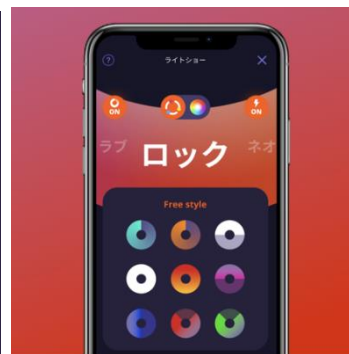
▲②ライティング設定