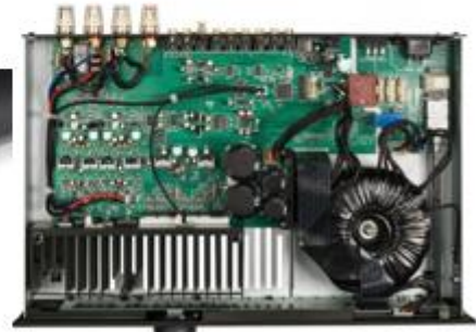
1976 年発売の A60(上)と SA20(下)の内部比較