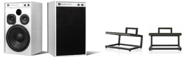
4312GWHT + JS-120