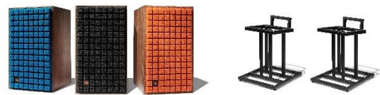
L82 Classic + JS-80