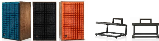
L100 Classic + JS-120