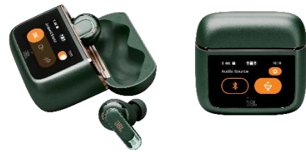
▲JBL Tour Pro 3(グリーン)