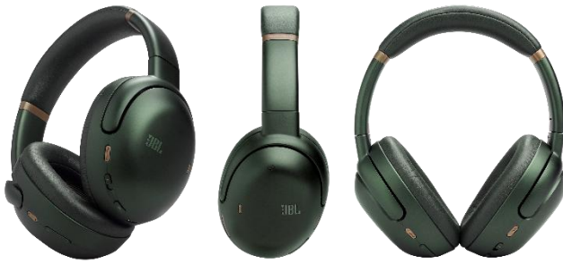
▲JBL Tour One M3(グリーン)