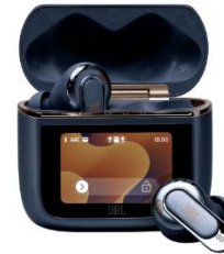
ブルー (Amazon 限定)