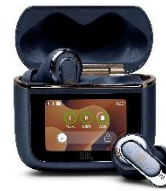
ブルー (Amazon 限定)